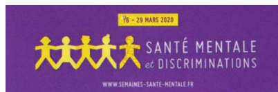
Table ronde et chansons

" Dans le cadre de la 31 e édition de "Santé mentale et discriminations", l'association Scène ouverte propose de débattre de l'intérêt de la culture au service de l'équilibre psychique avec des professionnels engagés tant au niveau local, sanitaire, artistique, qu'individuel. Entrée libre, le jeudi 19 mars de 20h à 21h30 à l'auditorium du Musée des Beaux-Arts d'Orléans. "